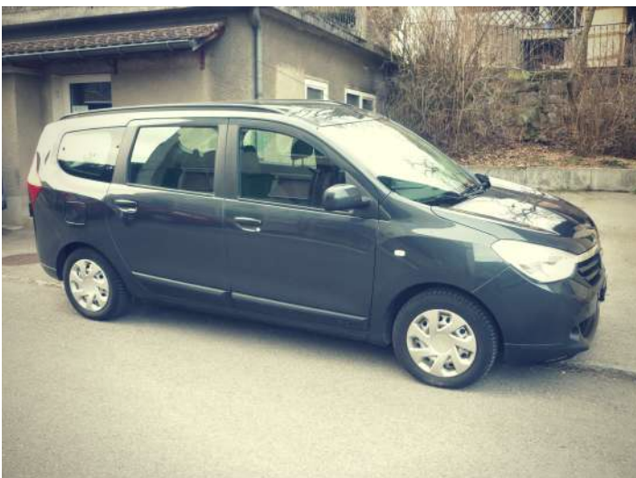
La voiture envoyée au Burkina.